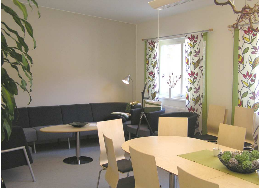
Figuur 4. Eet- en vergaderzaal in het ziekenhuis in Landskrona vóór de renovatie

De ruimte wordt gebruikt als eet- en vergaderzaal voor het personeel van de eerste hulp van het ziekenhuis in Landskrona. De inhoud van de ruimte is 69 \text{ m}^3 met een vloeroppervlak van 25 \text{ m}^2 . Zowel het plafond als de wanden bestaan uit gipsplaat zonder enige vorm van akoestische maatregelen. De ruimte voorafgaand aan de renovatie wordt weergegeven in figuur 4.