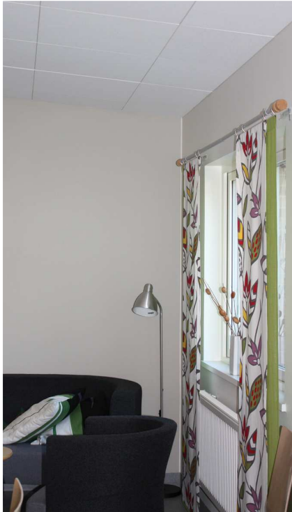
Figuur 5. Plafond Ecophon Master B