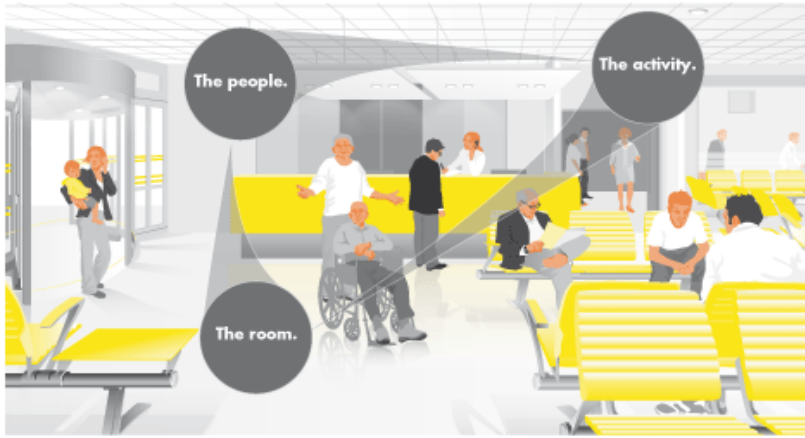
Figuur 1. Room Acoustic Comfort™, een akoestisch ontwerp-benadering die rekening houdt met de interactie tussen mens, activiteit en ruimte