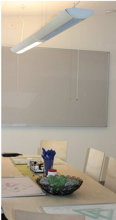
Figuur 6. Wandpaneel: Ecophon Wall Panel C/Texona

De praktische absorptiecoëfficiënten voor plafondpaneel Ecophon Master B en Ecophon Wall Panel C/Texona zijn gelijk. De absorptiegrafiek wordt weergegeven in figuur 7.