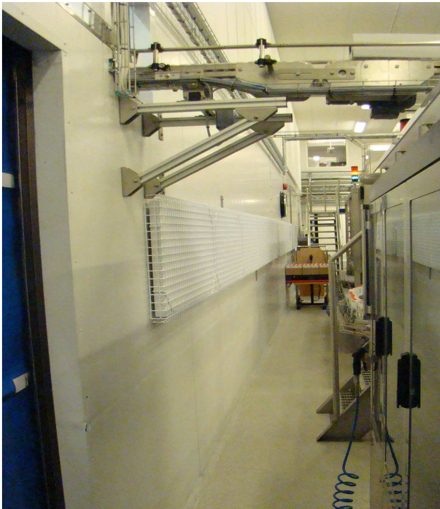
Figuur 9. Hygiene Advance Protection C3 op de wand dicht bij de lawaaige machines

Om de geluidsniveaus op locaties met hoge blootstelling te verminderen, werden er ook zo dicht mogelijk bij de geluidsbronnen wandpanelen gemonteerd. Een dergelijke locatie was de "gang" tussen de machines en de wand, zoals weergegeven in figuur 9. De panelen werden op hoofd-hoogte gemonteerd.