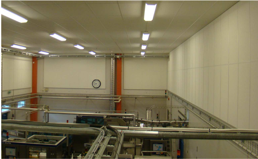
Figuur 8. Akoestische maatregelen aan het plafond en de wanden van de Oatly-fabriek

Om de geluidsniveaus op locaties met hoge blootstelling te verminderen, werden er ook zo dicht mogelijk bij de geluidsbronnen wandpanelen gemonteerd. Een dergelijke locatie was de "gang" tussen de machines en de wand, zoals weergegeven in figuur 9. De panelen werden op hoofd-hoogte gemonteerd.