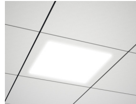
Потолок Focus Dg со светильниками Ecophon Square LED.