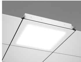
Элемент Ecophon Square LED Dg