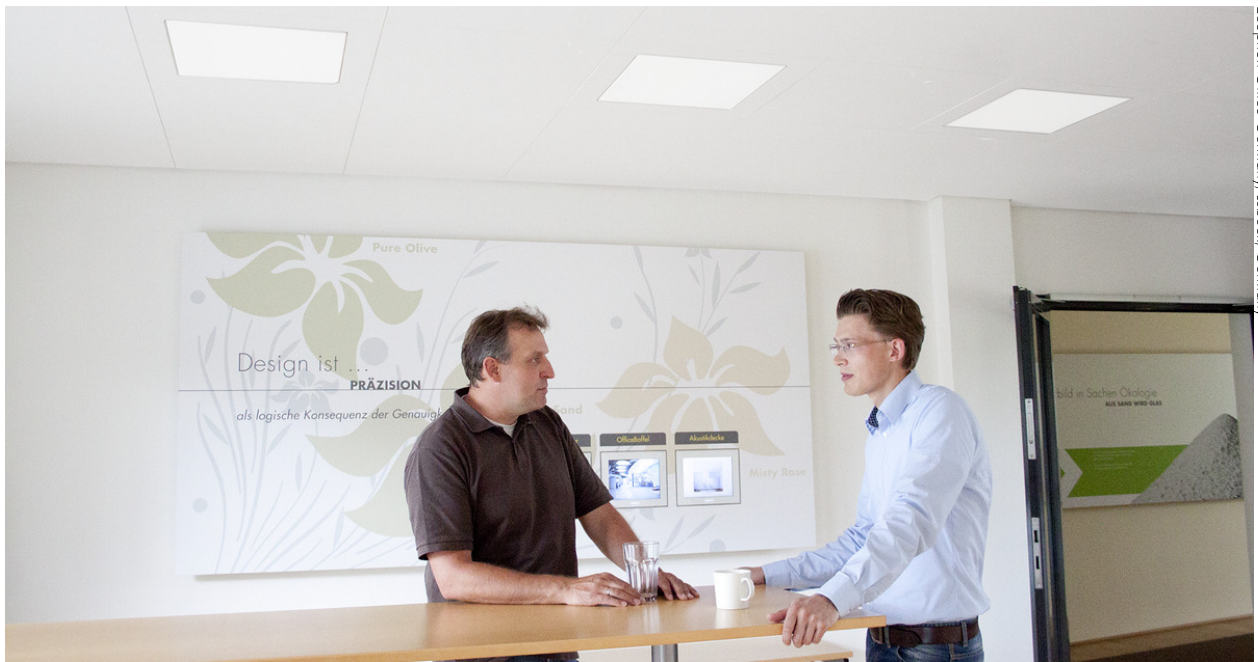
Ecophon Office Germany, Lübeck, Germany

светильника около 3,3 кг. (без учета веса блока управления и панели). Система запатентована и имеет регистрационный номер в Сообществе Дизайнеров (Registered Community Design). Светильник доступен в 3 различных вариантах: стандартном, с регулировкой мощности или функцией аварийного освещения в течение 1 часа. Блок управления с регулировкой мощности подготовлен к подключению датчиков SwitchDIM, DALI, DSI.