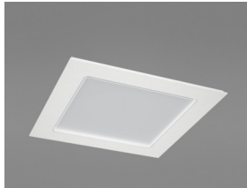
Панель Ecophon Square LED Dg