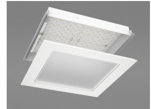
Светильник Ecophon Square LED Dg.