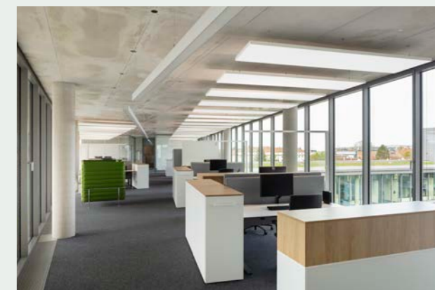
Die akustische Zonierung minimiert die Schallausbreitung in der offenen Bürolandschaft.

Frühzeitig wurden auch Bedenken seitens der Mitarbeiter:innen wegen einer möglichen Lärmbelastung wahrgenommen – gerade wegen der schallharten Oberflächen. Besagte Raumteiler beispielsweise sind entsprechend gepolstert und wie die Trennwände zwischen Mitarbeiter:innen mit Stoff bespannt. Auch ein grauschwarzer Nadelfilz als Bodenbelag sorgt für ein wenig Schallreduzierung. Weil aber eine Betonkernaktivierung in den Decken der Grundtemperierung dient, konnten diese nicht zur Reduktion von Schallpegel und Nachhallzeit herangezogen werden. (Eine individuelle Temperaturregelung erfolgt durch Bodenkanal-