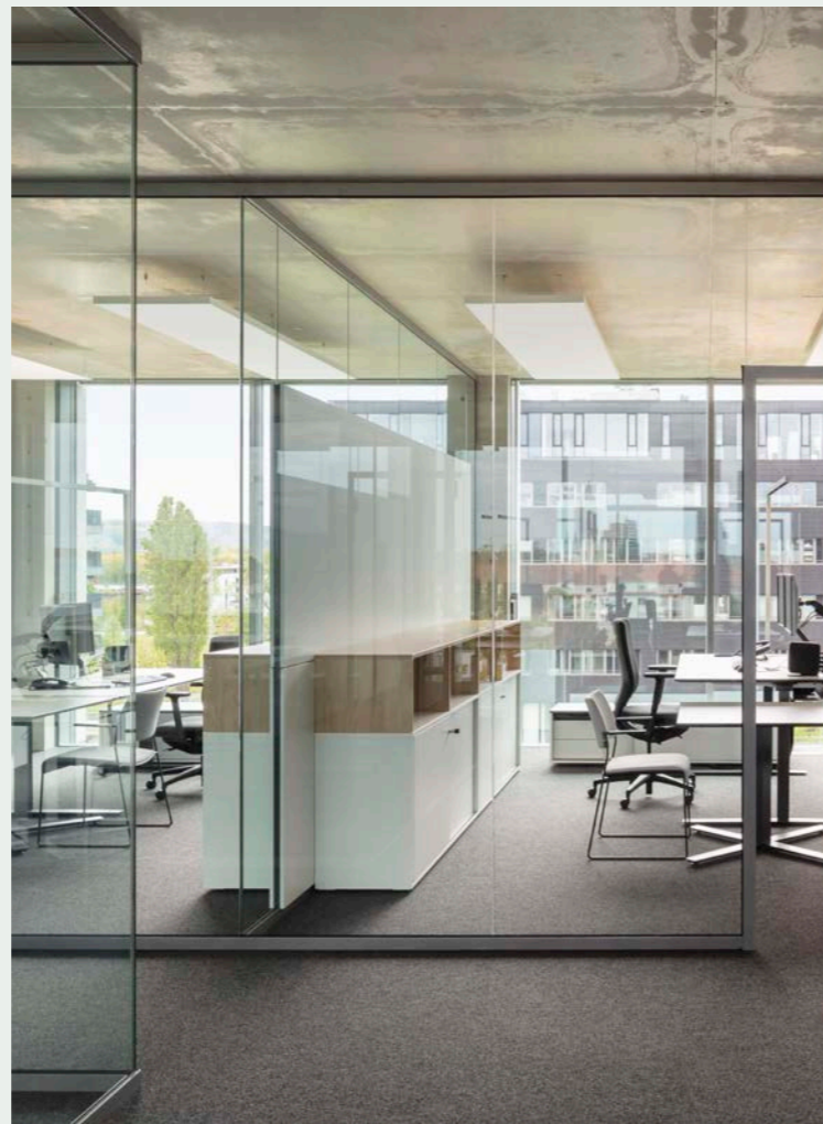
Zwischen den Arbeitsplätzen an den Fenstern und der Mittelzone befindet sich manchmal eine Glaswand, die wenigsten Zwischenwände sind geschlossen.

In den Regelgeschossen aber wandelt sich das Bild: Dort herrscht eine – doch überraschende – räumliche Vielfalt. Weil weissenburger vorher in Rastatt in einem Bürobau mit Einzelbüros residierte, und die Unternehmensleitung in Karlsruhe Open Spaces plante, ging sie schon früh auf die Mitarbeiter:innen zu. Den Grundriss und die Möblierung konnten die Abteilungen ihren individuellen Bedürfnissen anpassen. Die Mittelzone ist mit intimen Besprechungsinselformen ausgestattet, mit Sitznischen und Telefonkabinen, mit gläsernen „Think Tanks“ und Stehtischchen, mit Kopierbereichen hinter schulterhohen Raumteilern, in die Garderoben integriert sind. Im Südflügel verlaufen in der Mittelzone auch Treppen in die nächsthöhere oder niedrigere Etage. Verschiedene Weiß- und Grautöne sind mit Holz die dominierenden Farben, wobei alles Mobiliar, alle Ausstattung