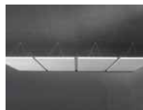
Huit Ecophon Solo Square installés avec Connect Fixation en un seul point