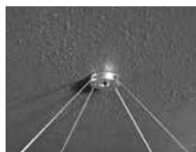
Connect Fixation en un seul point, fixée sous le support avec deux câbles ajustables