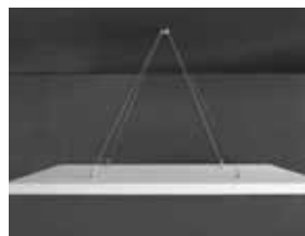
Ecophon Solo Square installé avec Connect Fixation en un seul point et deux câbles ajustables Connect